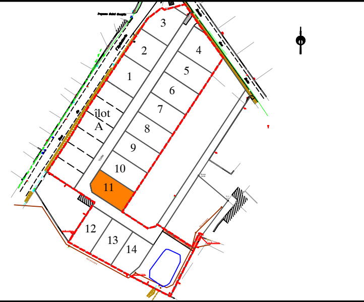
PLAN D'ENSEMBLE - Sans échelle