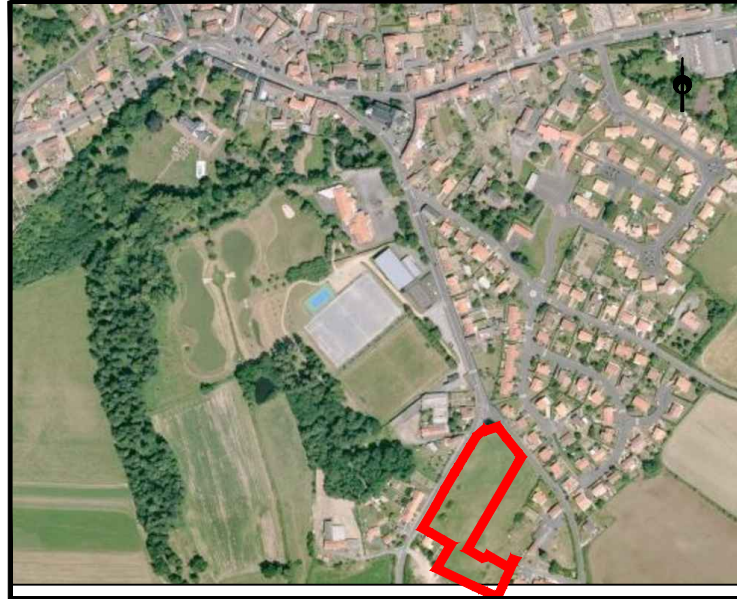
PLAN DE SITUATION - Sans échelle